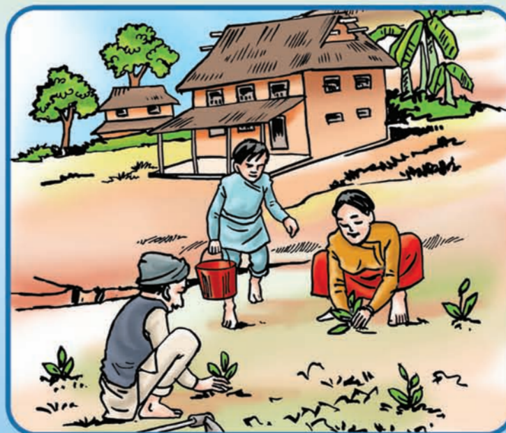
घर जरिपरि रुख विरुवा (केरा) रोप्ने ।