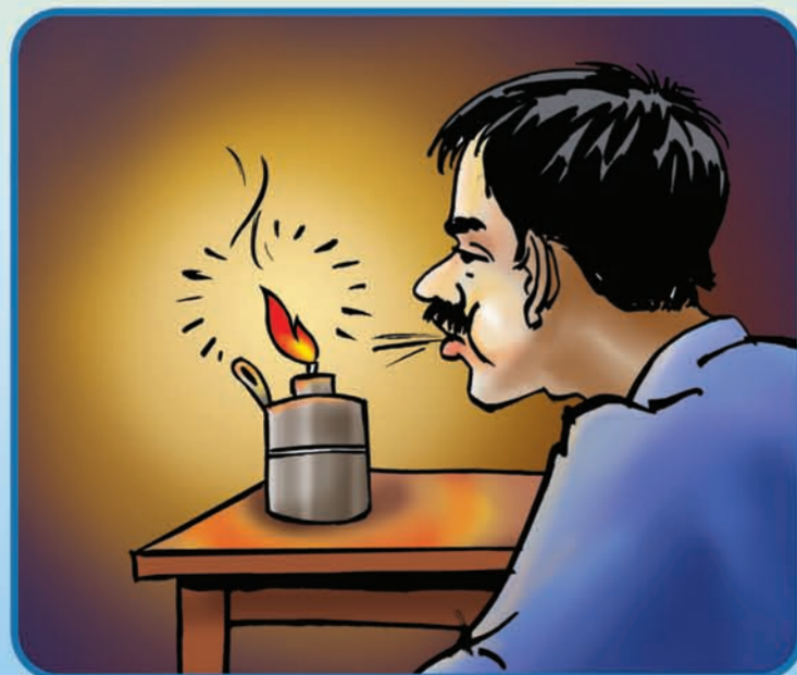
सुत्तु अघि टुकी निभाउने र चुरोट बिँडी निभाएर फाल्ने ।