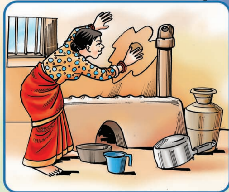
भान्साघरको भित्तामा बाक्लो लिउन लगाउने ।