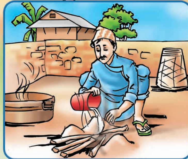
घरबाहिर जताभावी आगो नबाल्ने, बाल्ने परे बालिसकेपछि सुरक्षित रूपले निभाउने ।