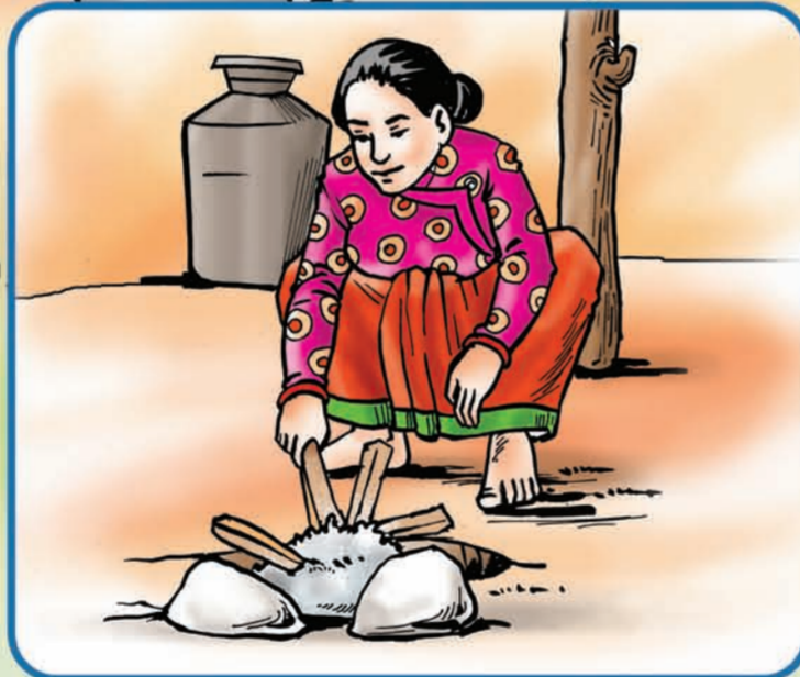
खाना पकाइसकेपछि आगो निभाउनुका साथै ग्यास चुल्होबाट ग्यास चुहिएको नचुहिएको हेर्ने ।