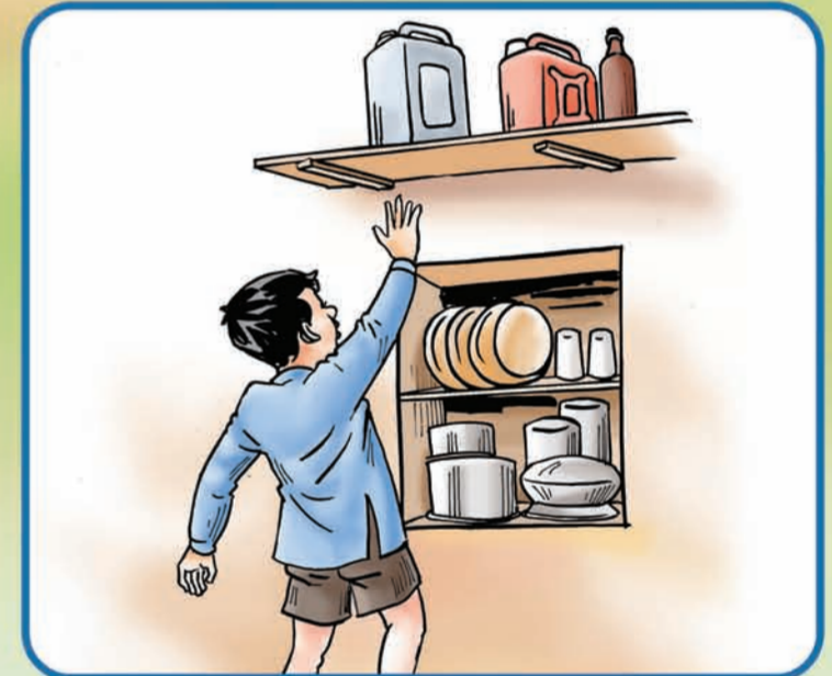
आगो लाग्न सक्ने चिजहरू जस्तै पेट्रोल, डिजेल, मट्टीतेलका साथै सलाई, लाईटर जस्ता कुराहरू बच्चाहरूले नभेट्ने ठाउँमा राख्ने ।